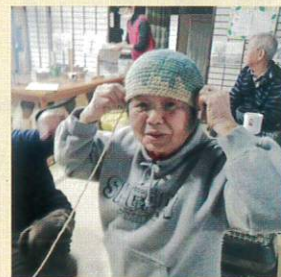
すずかけ手仕事部にて。可愛い帽子を作りました!