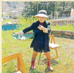
「コミュニティガーデンびんたぽ」にて。農作業に精が出ます。