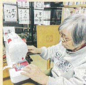
ミシンもお手のもの!