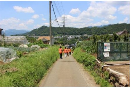
Shu オーナーご夫妻に見送られ、たすきはチーム青年達へ、元気いっぱい進みます 藤野らしい道をにぎやかに...