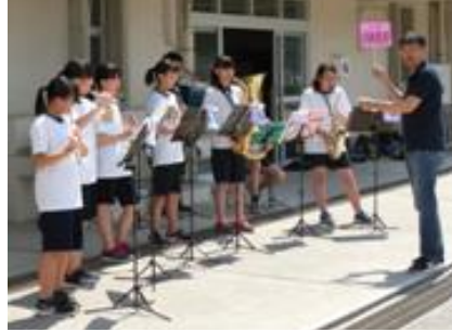
吹奏楽部の演奏に迎えられます