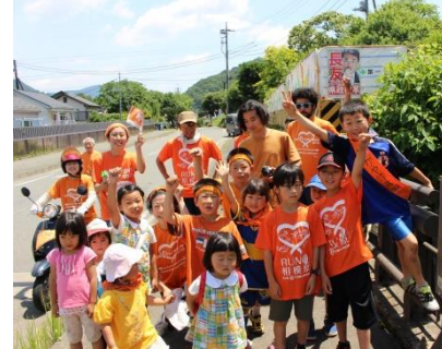
相模湖から車移動で藤野に戻り仕切り直します