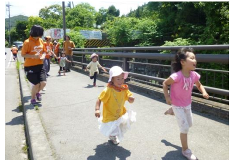
さあこれからのびるっ子園児、のびるっ子 OB が走ります