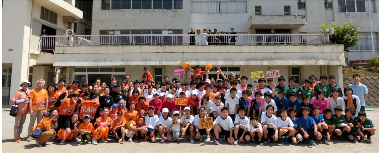
ソフトテニス部、サッカー部、卓球部、吹奏楽部、それに加えて練習中だった剣道部も参加してくれました