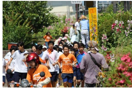
駅前を清掃中の自治会の方に見送られ通学路の挨拶道路へと進みます