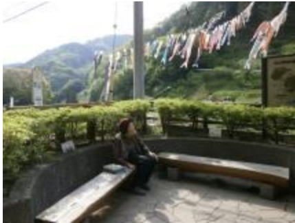
《春》 和田こいこい祭(佐野川)

フットワーク軽くみんなでさくさくお出かけしています。利用者さんも職員もとってもうれしそう。